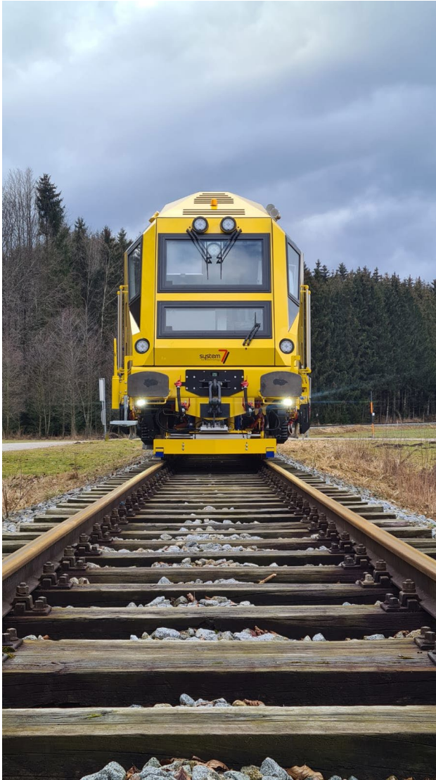
Vorwagen des System7 Stoproboters S7 PLS 16 4.0 - S