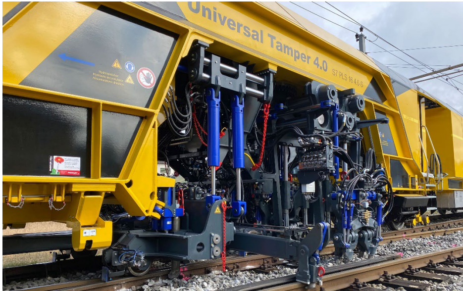
Weichenstopfen mit dem System7 Stopfroboter S7 PLS 16 4.0 - S