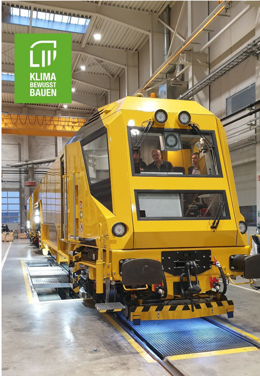
Mitarbeiter von LEONHARD WEISS begutachten den System7 Stopfroboter S7 PLS 16 4.0 - S

Projekten des Bauunternehmens künftig neue Maßstäbe in der Stopftechnologie, in Punkto Qualität und beim Umweltschutz setzen.